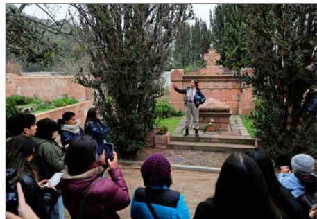
El Cementerio Santa Inés abrió sus puertas en Viña del Mar con recorridos por sus espacios históricos, destacando relatos y personajes de la ciudad.