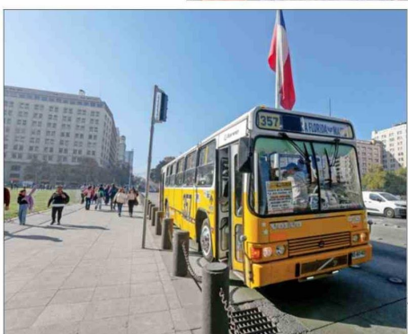
Las micros amarillas volvieron a las calles con paseos gratuitos desde el metro Quinta Normal a través de las principales calles de Santiago.