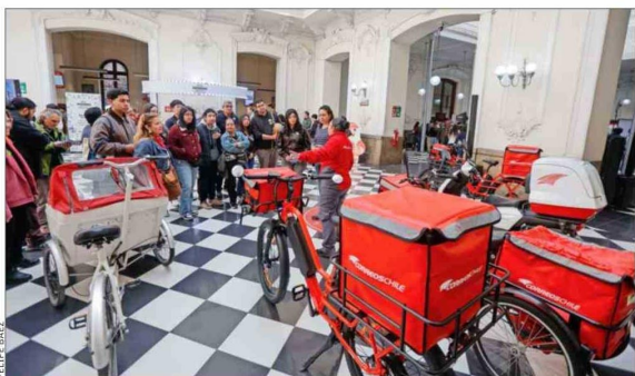
Correos de Chile abrió las puertas del histórico Correo Central, invitando a recorrer su edificio patrimonial, recientemente restaurado.