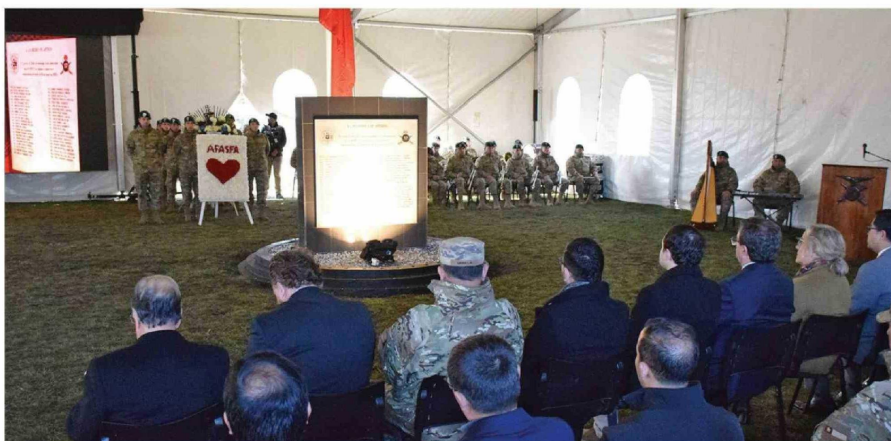
FAMILIARES DE LOS SOLDADOS FALLECIDOS rindieron homenaje a sus seres queridos asistiendo al acto organizado por el Ejército.

La jornada reunió a familiares, sobrevivientes y autoridades, encabezadas por el ministro de Defensa, Fernando Barros. Con posterioridad, se realizó una segunda ceremonia conmemorativa en el Memorial Mártires de Antuco.