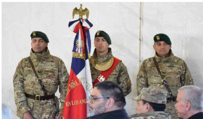
LA ACTIVIDAD CONTÓ con la presencia de autoridades nacionales y de la región del Biobío.

que se niega a desaparecer ante el frío, el olvido y el paso del tiempo: la memoria", sentenció.