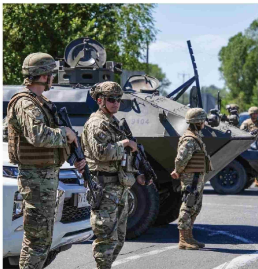
PROGRAMAS COMO EL PLAN BUEN VIVIR y fondos sectoriales han permitido reforzar la presencia estatal en comunas cordilleranas del Biobío

Según explicó el representante del Gobierno en la provincia, el objetivo del estado de excepción no ha sido solo contener la violencia, sino también sentar las bases para una recuperación integral de los territorios afectados. En ese sentido, Fuchslocher subrayó que la estrategia ha apostado por un fortalecimiento de la coordinación entre instituciones, lo que ha permitido una respuesta más eficaz ante hechos de violencia y otras emergencias, como los incendios forestales.