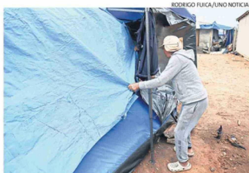
"AÚN FALTAN MANOS", DICEN LOS VECINOS DAMNIFICADOS.