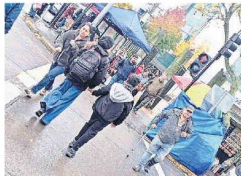
MUCHOS PACIENTES INGRESAN POR ESE ACCESO DEL HOSPITAL.

Agregó que “han habido situaciones de violencia entre los ambulantes