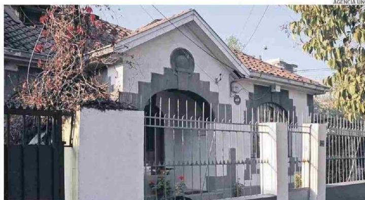
EL HOMBRE DE 37 AÑOS FUE ENCONTRADO EN EL SEGUNDO PISO DE LA CASA QUE PERTENECÍA A LA ACTRIZ.

Título: Con las manos amputadas fue encontrado el hijo de la actriz Lorene Prieto