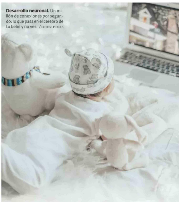
Desarrollo neuronal. Un millón de conexiones por segundo: lo que pasa en el cerebro de tu bebé y no ves.