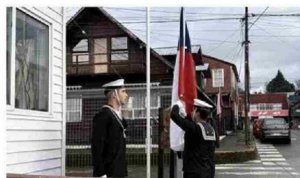
QUEMCHI: IZAMIENTO DE LA BANDERA EN LA CAPITANÍA DE PUERTO.