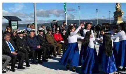
CIVILES Y UNIFORMADOS COMPARTIERON EN LA ACTIVIDAD POR EL MES DEL MAR Y LAS GLORIAS NAVALES EN QUEILEN.