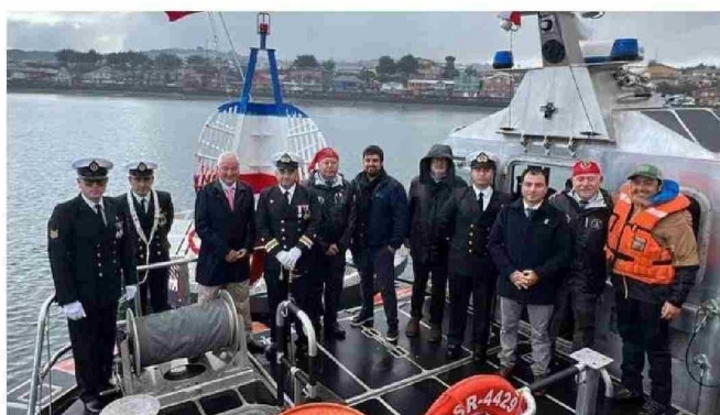
EN LA BAHÍA DE QUELLÓN SE INSTALÓ UNA BOYA PARA RESALTAR ESTE MES Y A LOS HÉROES NAVALES DEL PAÍS.

E l relativo buen tiempo atmosférico permitió conmemorar sin contratiempos las Glorias Navales en distintas localidades chilotas este miércoles. En algunas comunas hubo actividades en la jornada anterior e incluso en Ancud hoy se desarrolla el desfile por los combates navales. 🇨🇱