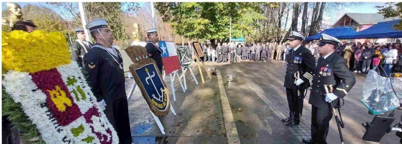
ARRIBA Y ABAJO: INSTANTES DEL DESFILE Y ACTO PROVINCIAL POR LA EFEMÉRIDE EN LA PLAZA DE ARMAS DE CASTRO. CHILOTES Y VISITANTES HONRARON A LOS HÉROES DE IQUIQUE Y PUNTA GRUESA.