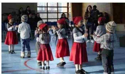
OPORTUNAMENTE SE EFECTUÓ EL ACTO RESPECTIVO EN EL LICEO ALFREDO BARRÍA OYARZÚN DE CURACO DE VÉLEZ.