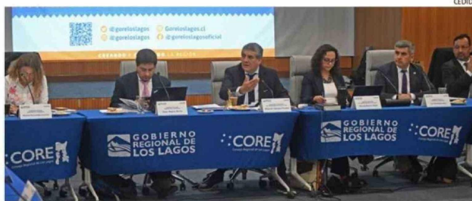
EL PLENO DEL ENTE COLEGIADO APROBÓ AYER EL INSTRUMENTO PRESENTADO POR EL MUNICIPIO.

pera de los últimos trámites administrativos, todavía tenemos que pasar por la Contraloría General de la República y esperamos que esto pueda ser enviado lo más pronto posible desde el Go-