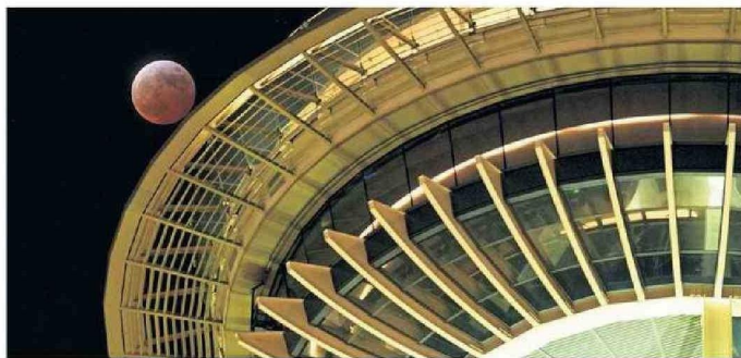
ECLIPSE EN SEATTLE, ESTADOS UNIDOS.