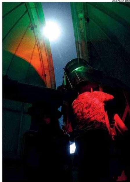
SE PREPARA EL OBSERVATORIO DEL CERRO SAN CRISTÓBAL.