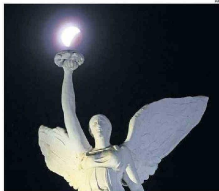
ECLIPSE DESDE TORONTO, CANADÁ.