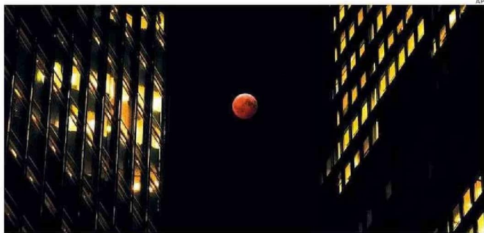
ECLIPSE EN CHICAGO, ESTADOS UNIDOS.