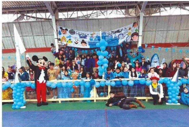
→ Alianza Disney en el Colegio Instituto Rancagua.

» La actividad se realizó el pasado 13 de mayo y convocó a estudiantes desde educación parvularia hasta enseñanza media.