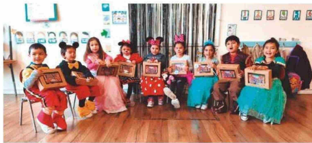
→ Los más pequeños brillaron con sus disfraces.

convivencia y recreación dentro de la comunidad escolar. Las actividades incluyeron momentos musicales, presentaciones y desafíos entre ambos equipos, en una dinámica que mantuvo una constante interacción entre los estudiantes.