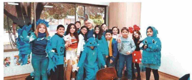
→ Alumnos disfrazados en el Día del Alumno.