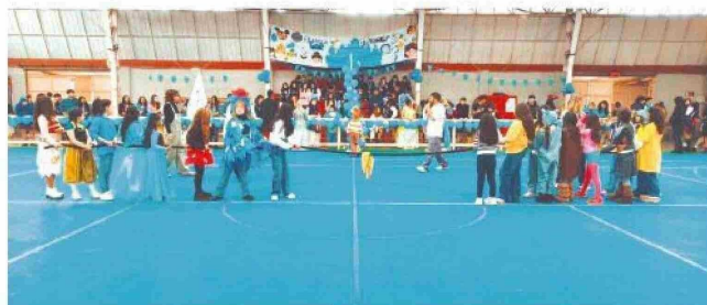
→ Juego de tirar la cuerda. Una de las tantas actividades en la jornada.