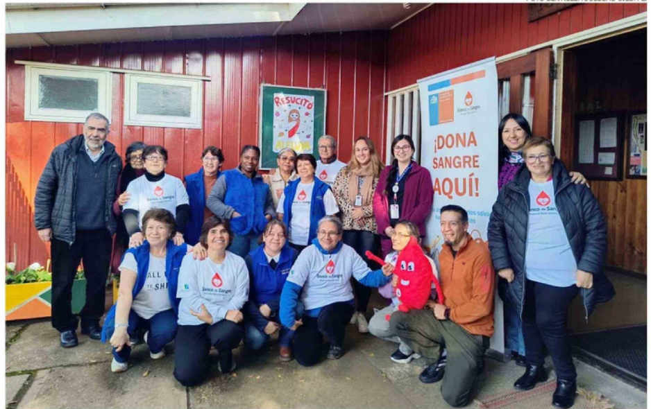
LOS VOLUNTARIOS DEL GRUPO SON INTEGRANTES DEL GRUPO DE MISIONEROS SEMBRADORES DE ESPERANZA DE LA PARROQUIA CRISTO REY DE VALDIVIA.