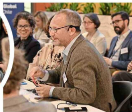
Gonzalo Muñoz, champion de la COP25, expuso en el encuentro.