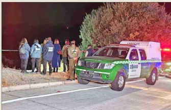
La fiscalía y el OS9 de Carabineros quedaron a cargo del caso, en la cuestra Zapata.

Seis cuerpos fueron recuperados desde la cuestra Barriga en abril del año pasado. El hecho marcó el inicio del frecuente abandono de víctimas de homicidio en esa zona, en el marco del crimen organizado.