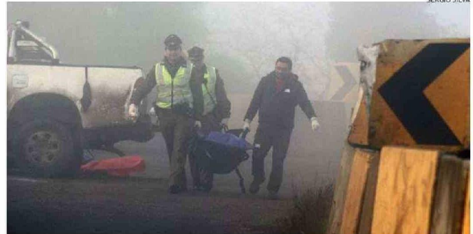
LOS CUERPOS DE LOS FALLECIDOS FUERON LLEVADOS AL SERVICIO MÉDICO LEGAL DE OSORNO.

dores fueron retirados pasadas las 8.30 de la mañana, luego de ser periciados por personal de la Subcomisaría Investigadora de Accidentes del Tránsito.