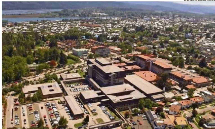
EL HOSPITAL DE VALDIVIA ENFRENTARÍA UNO DE LOS MAYORES RECORTES DEL PAÍS.

"Desde regiones no vamos a quedarnos callados mientras desde Santiago se toman decisiones que pueden terminar debilitando hospitales fundamentales para el sur de Chile. El Hospital Base Valdivia cum-