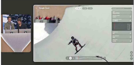
El snowboardista Shaun White perfeccionó sus acrobacias con el análisis de la IA, que no requiere sensores.