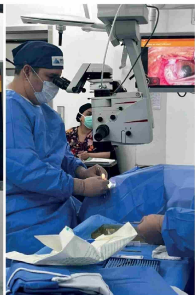
REGISTRO DE LA PRIMERA CIRUGÍA OFTALMOLÓGICA con injerto de membrana amniótica desarrollada en el CAVRR.

tienen mayor exposición solar y más dificultad para acceder a tratamientos especializados", indicó el especialista.