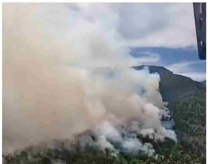
La declaración de Alerta Roja para la comuna de Pinto permite, según explicó Senapred, movilizar de manera inmediata todos los recursos necesarios.