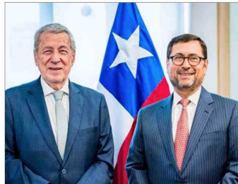
El encuentro de Cancillería entre Alberto van Klaveren y Francisco Pérez Mackenna estuvo marcado por la nominación de Bachelet a la ONU.

X (ex-Twitter): "Todas las obras que nosotros hacemos tienen un sentido bien profundo, entonces cortar una cinta tiene un significado importante". Incluso el Presidente Boric se involucró, cuando desde su gira en el sur sostuvo: "Cortar cintas, inaugurar una obra, tiene un sentido bien profundo. Yo lo veo desde honrar un trabajo que se ha hecho, largo, a veces duro. Honrar a todos los funcionarios públicos que han entregado su esfuerzo".