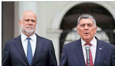
El ministro Álvaro Elizalde (Interior) y su sucesor, Claudio Alvarado, coordinan el proceso de traspaso entre las carteras.

Hubo momentos de tirantez en las reuniones de Vivienda, Relaciones Exteriores e Interior. La Moneda impartió una instrucción en el sentido de "no dejarse pasar a llevar" en esos encuentros.