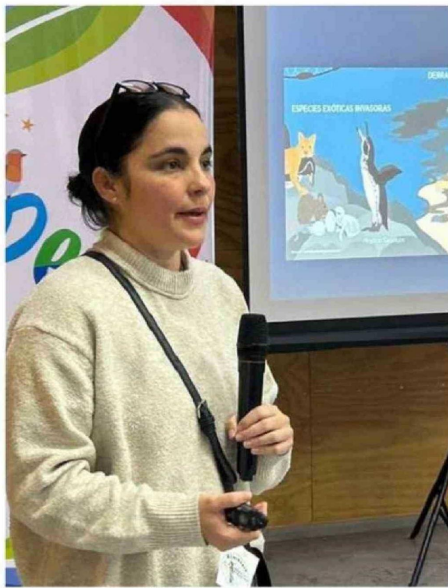
LA JORNADA INCLUYÓ UNA SERIE DE CHARLAS QUE DIERON CUENTA DEL VALOR DE ESTAS AVES NO VOLADORAS.

Uno de los focos principales fue relevar la importancia del territorio chilote como hábitat para el pingüino de Humboldt y el