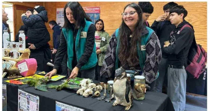
PUÑIHUIL ES UN PUNTO ESTRATÉGICO Y VALIOSO PARA LA CONSERVACIÓN DE LOS PINGÜINOS.