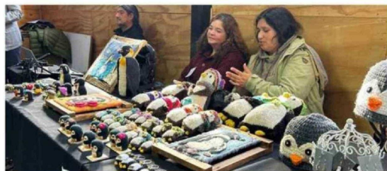
SE PRESENTARON MÓDULOS QUE EXPLICARON LAS CARACTERÍSTICAS DEL AVE Y DE EMPRENDEDORES LOCALES.

de reproducción, que es uno de los ciclos más claves y sensibles para la conservación de la especie”.