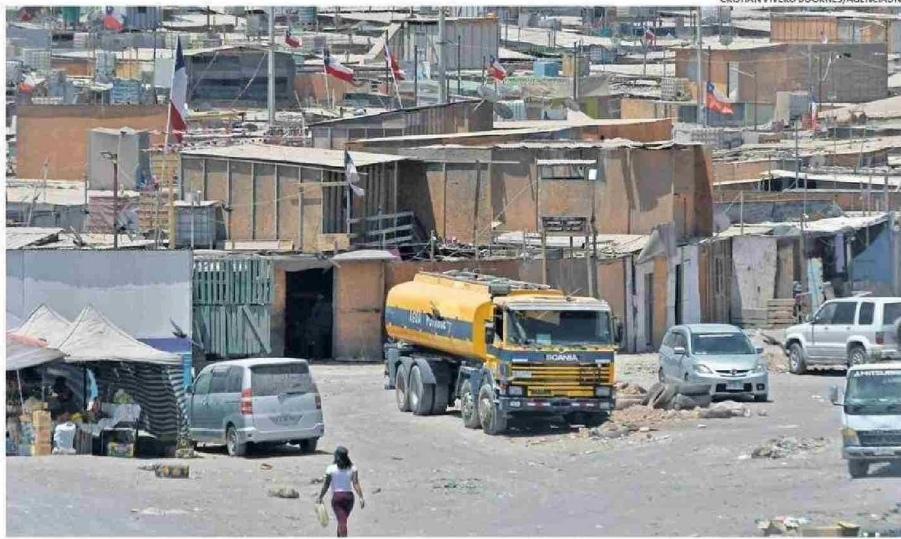
ALTO HOSPICIO ES LA COMUNA QUE ALBERGA MÁS CAMPAMENTOS EN LA REGIÓN Y UNA DE LAS MÁS VULNERABLES DEL PAÍS.

Otro dato súper importante también es que 44 campamentos de los 63 que existen en Iquique se emplazan en Alto Hospicio, que es la comuna más pobre del norte, según la Censo de 2022, entonces hoy