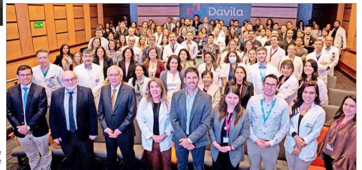
Red Dávila y Universidad de los Andes: 30 años de convenio docente.