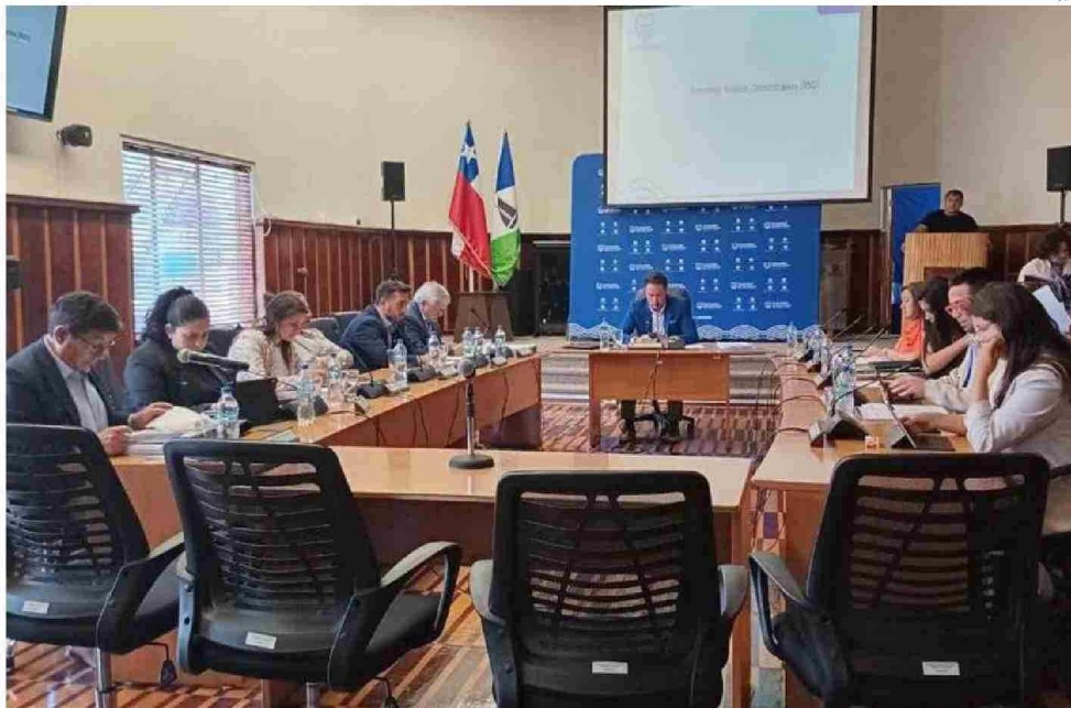
EN SESIÓN EXTRAORDINARIA, EL CONCEJO MUNICIPAL APROBÓ AYER EXTENDER EL CONTRATO A LA EMPRESA COSEMAR.

dijo el alcalde que alcanzan las multas por dejar escombros en los contenedores domiciliarios del área urbana.