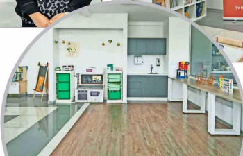
Los profesionales de Coaniquem pueden implementar mejor su Modelo de Atención Integral gracias a un mayor espacio para el área psicosocial.