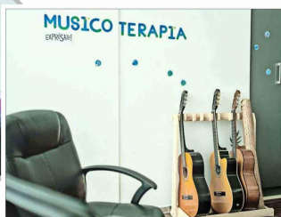
La sala de musicoterapia es una de las que se incorporó gracias a esta ampliación.