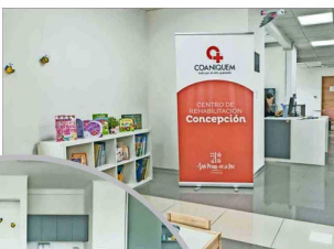
La ampliación permitió aumentar las especialidades y las horas de atención, incluyendo psicopedagogía, musicoterapia, entre otras.