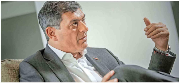
FRANCO PARISI Y EL APOYO DEL PDC A LA "LEY DE RECONSTRUCCIÓN":

“Al ministro Jorge Quiroz lo respeto intelectualmente, nos conocemos hace mucho” D 3