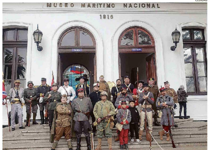
AGRUPACIONES DE RECREACIÓN HISTÓRICA Y VEHÍCULOS ANTIGUOS EN EL MUSEO MARÍTIMO.

"No se pierdan la obra, que va a ser simpática", manifiesta la ministra