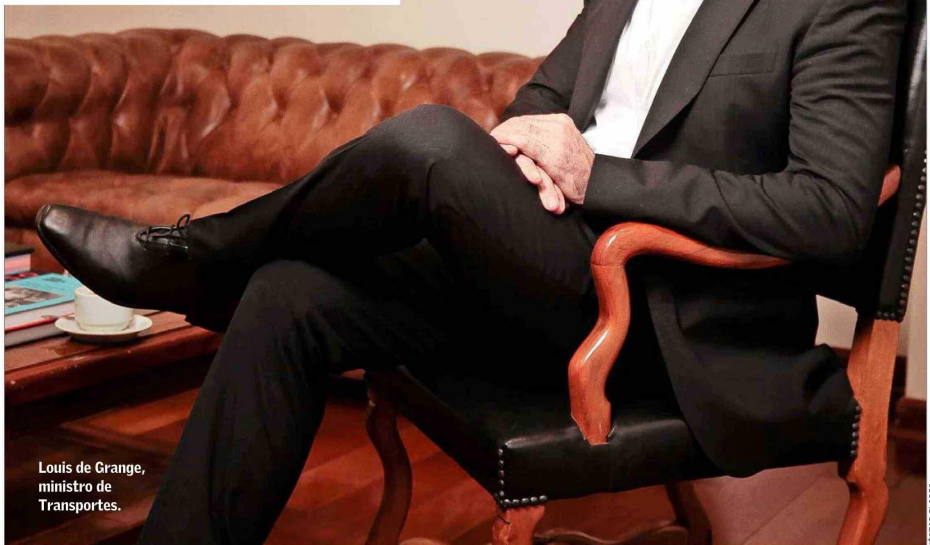
Louis de Grange, ministro de Transportes.

En marzo, el ministro de Transportes, Louis de Grange, y su equipo se reunieron con los representantes de la industria para escuchar sus principales preocupa-