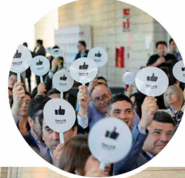
Se realizó una dinámica lúdica para la valoración de los proyectos de innovación.

La última semana de noviembre, en Casa Central de Duoc UC, se realizó Converge iCorp 24, un evento que reunió a autoridades, colaboradores y expertos para reflexionar y destacar los avances de la Innovación Corporativa en Duoc UC. En esta primera versión, el encuentro tuvo como objetivo principal dar a conocer los resultados de 12 proyectos destacados que, a través de su implementación local, muestran un alto potencial para ser replicados en otras sedes de la institución o escalados a nivel nacional con el apoyo administrativo de Casa Central. La jornada incluyó diversos espacios de reflexión y aprendizaje, como el panel "Innovación Corporativa en Duoc UC: Experiencias, resultados y próximos desafíos", con la participación del rector Carlos Díaz; Mauricio Andrés Frugone, coordinador del Laboratorio Varas; Paola Araya, directora de la Sede Viña del Mar, y Matías Flores Decar, subdirector de Admisión y Comunicaciones de la Sede Plaza Norte, que fue moderado por Catalina Petric, directora de Investigación Aplicada, Innovación y Transferencia de Duoc UC. Además, los asistentes disfrutaron de una charla magistral a cargo de Marcos Singer, director del MBA UC y Profesor Titular de la Escuela de Administración de la Pontificia Universidad Católica de Chile, quien abordó el rol crucial de la innovación en las organizaciones contemporáneas.