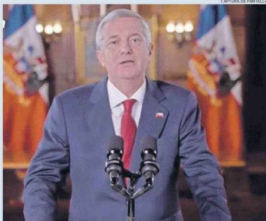
CAPTURA DE PANTALLA

El asunto fue corroborado por concejales, mientras el Municipio apuntó que los requerimientos de bomberos han bajado en los últimos meses. Pág. 3