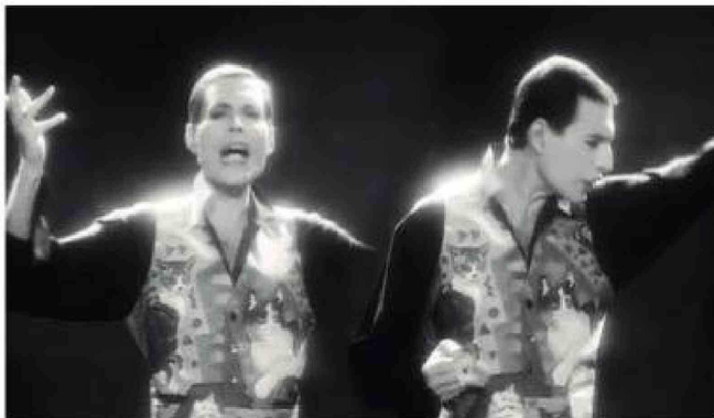
La ciudad suiza de Montreux se ha convertido en un auténtico santuario para fanáticos de Queen gracias al museo en los Mountain Studios.