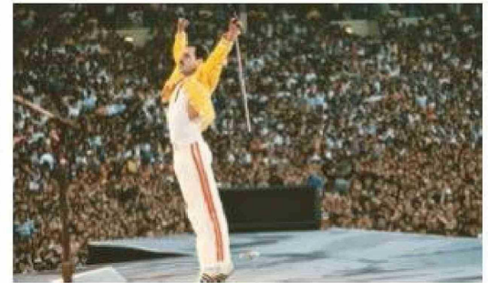
El diagnóstico de VIH en 1987 marcó sus últimos años, pero no detuvo su creatividad.