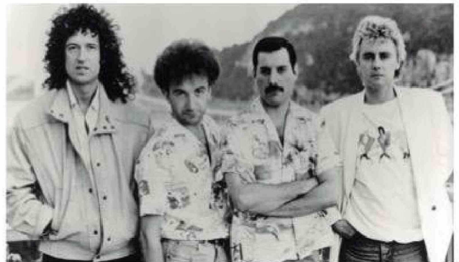
El legado musical de Freddie Mercury y Queen está más vigente que nunca tras el acuerdo millonario con Sony Music.