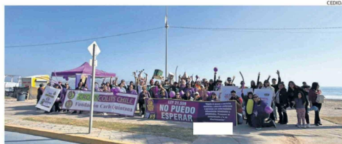
FUNDACIÓN CARLOS QUINTANA CROHN COLITIS COQUIMBO TUVO UNA RECIENTE REUNIÓN EL 16 DE MAYO.

Finalmente, la directora de la fundación filial Coquimbo destacó la reciente actividad de caminata del 16 de mayo en Coquimbo, además de invitar a todos los que no conocen de estas complejas enfermedades a que la conozcan y se informen, siendo la fundación un canal fiable para comunicar sus patologías. CB