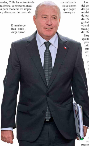
El ministro de Hacienda, Jorge Quiroga.