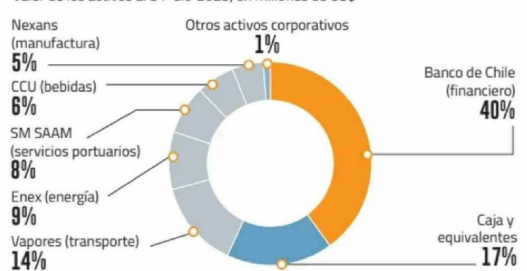
Valor de los activos al 31-dic-2025, en millones de US$