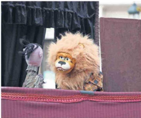
"Pantaleón el León" se presentará mañana en la Escuela Arturo Ebensperger Richter, de la mano de la compañía Dedos Pintados.