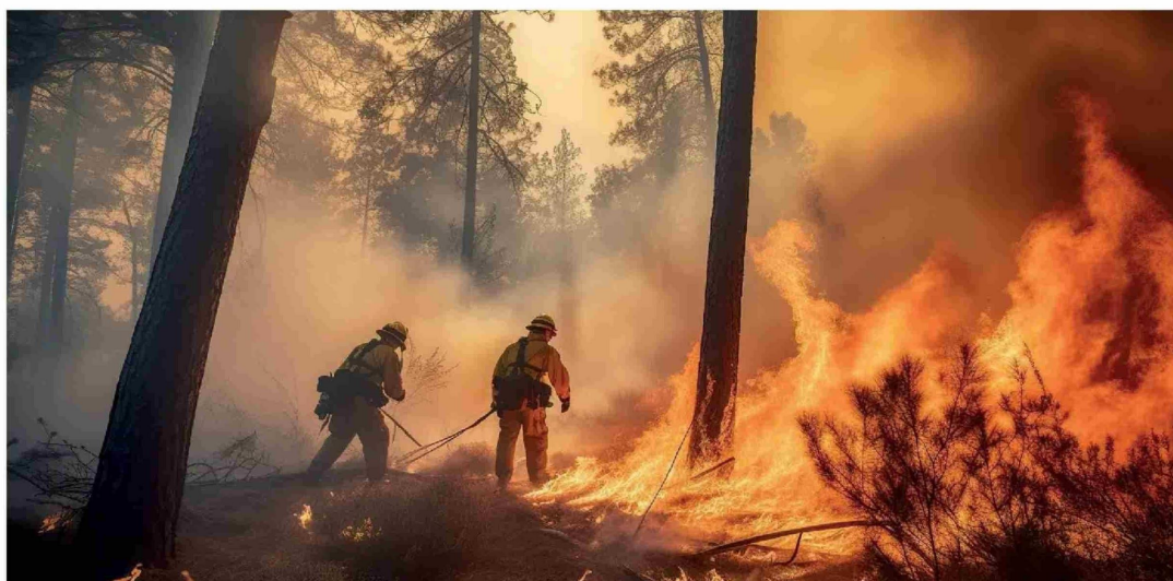
EL MARCO LEGAL VIGENTE CONTEMPLA SANCIONES desde cinco hasta 20 años de cárcel para quienes resulten responsables de provocar fuego.

En medio de la emergencia por incendios forestales, especialista abordó el endurecimiento de las penas en el Código Penal, que sanciona conductas imprudentes y no solo intencionales.