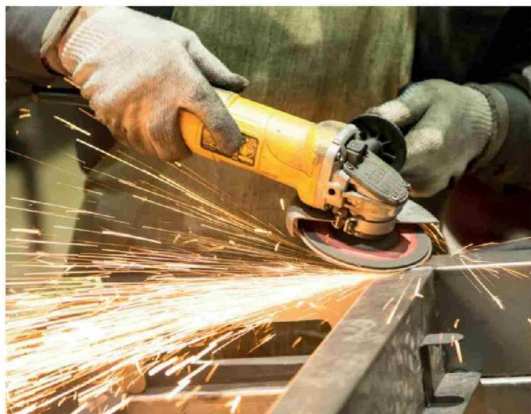
LA LEY ESTABLECE RESPONSABILIDAD penal no solo para quienes actúen con dolo directo, sino también para quienes provocaron el incendio sin intención directa.

Finalmente, advirtió que el tiempo juega en contra de las investigaciones. "Mientras más lejos estemos de los hechos, más difícil es encontrar a los responsables. Los primeros días son muy relevantes, porque la evidencia va desapareciendo", concluyó.