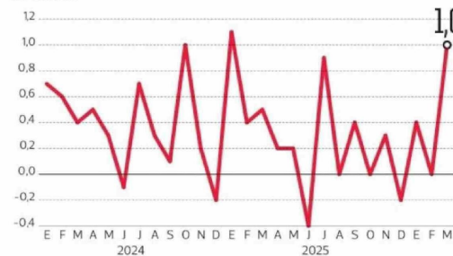
IPC de marzo registra la mayor alza desde hace un año Var % anual