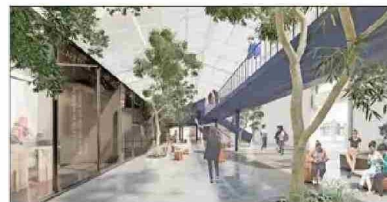
Tanto el Museo Regional de Ñuble (en la foto) como el Archivo Regional están en etapas iniciales del proceso.