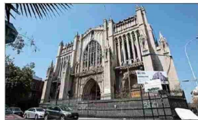
Iniciar el proceso de restauración de la Basílica del Salvador es uno de los proyectos que avanzan.