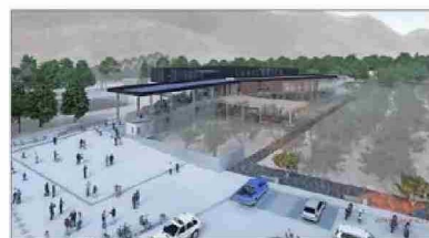
Años de retraso lleva el nuevo Museo Antropológico San Miguel de Azapa, que este año sería licitado.

ocho pisos, cuatro subterráneos y cuatro en altura.