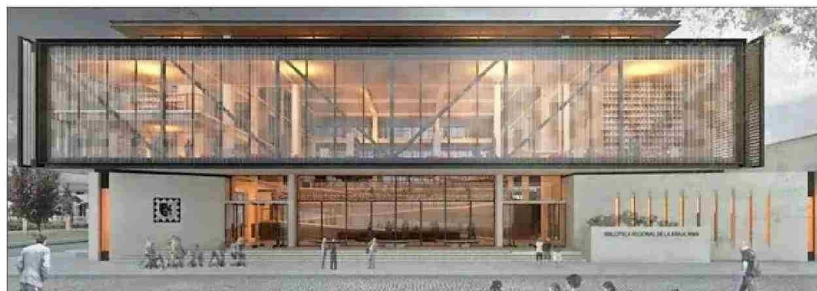
La Biblioteca y Archivo de La Araucanía ya está en obras civiles.

Las bibliotecas de Magallanes, Los Lagos y La Araucanía están en obra, pero otros proyectos están recién en etapas de diseño o licitación.