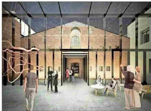
La ex cárcel de Punta Arenas se está transformando en la Biblioteca y Archivo Regional de Magallanes.

Las bibliotecas regionales de Los Lagos y La Araucanía iniciaron sus obras la segunda mitad de 2025 y no estarán listas antes de 2027. La primera tendrá casi seis mil metros cuadrados y un presupuesto de unos $24 mil millones. La nueva dependencia vendrá a sustituir