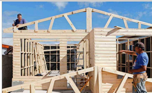
ANGUSTIA. — Los afectados por el megaincendio se preparan para vivir un nuevo invierno en mediaguas o viviendas precarias construidas por sus propios medios.

Oficina Atisba estudió imágenes del 22 de febrero pasado, recién liberadas por Google Earth: