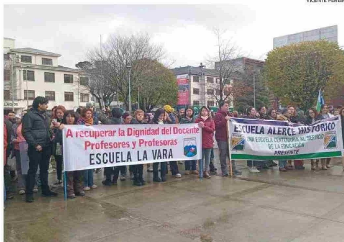
LA MARCHA DE AYER TERMINÓ CERCA DE LAS 12 HORAS, CON UNA CONCENTRACIÓN EN LA PLAZA DE ARMAS.

A nivel local, expuso Villarroel, existe inquietud por la próxima instalación del Servicio Lo-