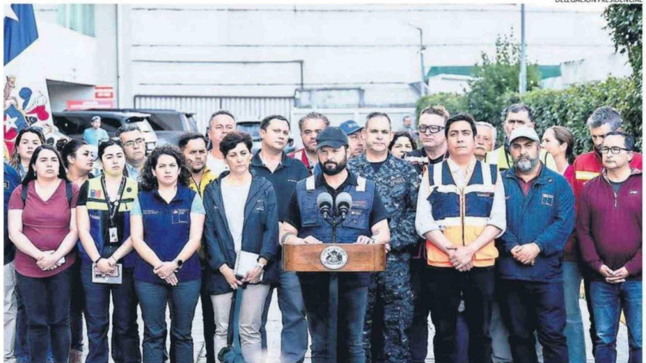
EL PRESIDENTE BORIC ENCABEZÓ UNA REUNIÓN EN CONCEPCIÓN PARA COORDINAR EL DESPLIEGUE Y LAS MEDIDAS ANTE LOS INCENDIOS.

En la última actualización entregada por Conaf, se indicó que se han quemado más de 16 mil hectáreas preliminares en los incendios de Rancho Chico y de Trinitarias, que unidos generaron el megaincendio en Concepción, Penco y Tomé.