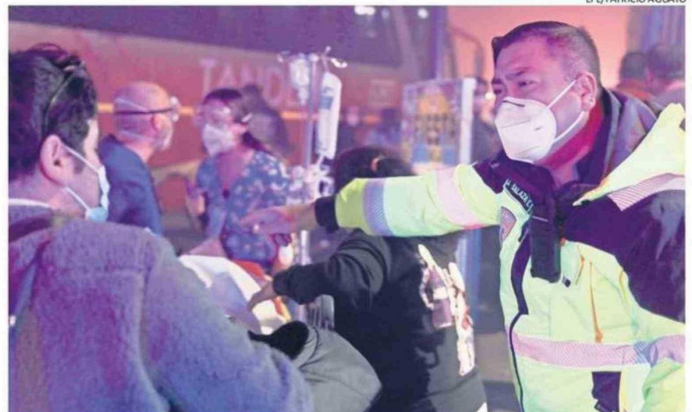
EL HOSPITAL PENCO-LIRQUÉN TAMBIÉN DEBIÓ SER EVACUADO ANTE LA EMERGENCIA.

der que la emergencia es compleja y no es que instantáneamente se van a resolver estos problemas, pero la institucionalidad está trabajando y dando cuenta para responder lo más rápido posible".