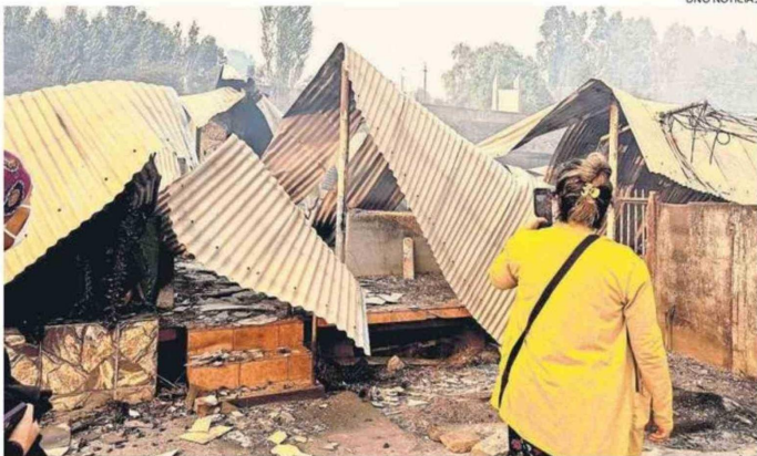
LA DESTRUCCIÓN EN LOS SECTORES DE PENCO Y LIRQUÉN IMPACTÓ A LA COMUNIDAD.