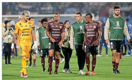
Carabobo, que en 2025 se midió con la U por la Libertadores, ahora se prepara para recibir a Huachipato. Falta saber dónde.

Más detalles en www.elmercurio.com/deportes