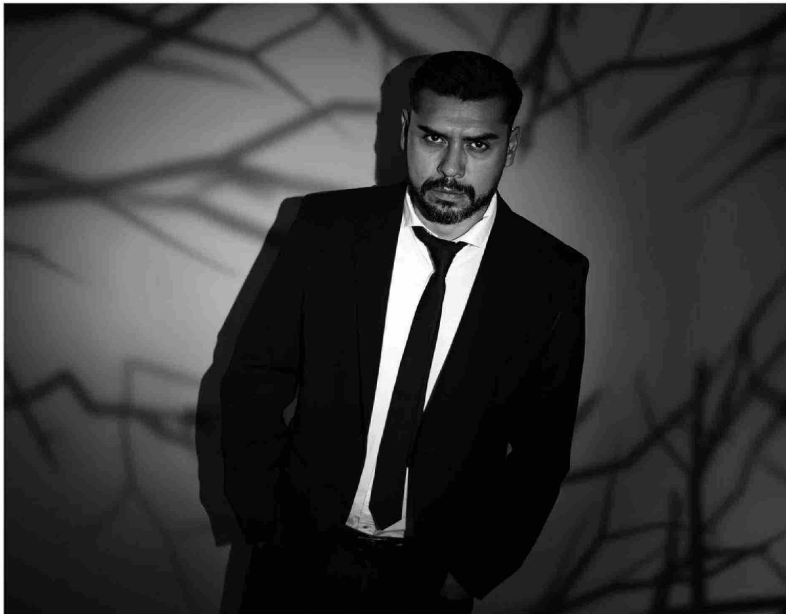
"Me demoro mucho en investigar, meses, incluso hasta un año estoy investigando para mis proyectos", dice el autor.

"Todos mis libros se basan en investigaciones. Yo no me demoro mucho en investigar, meses, incluso hasta un año estoy investigando para mis proyectos", agrega el también autor de "Los que susurran bajo la tierra", cuya área "de investigación en la universidad es la estética del horror" y sus clases son de literatura creativa y oratoria. En estas últimas clases se mezclan estu-