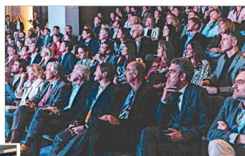
Una amplia convocatoria tuvo la inauguración del nuevo centro de Clínica MEDS.