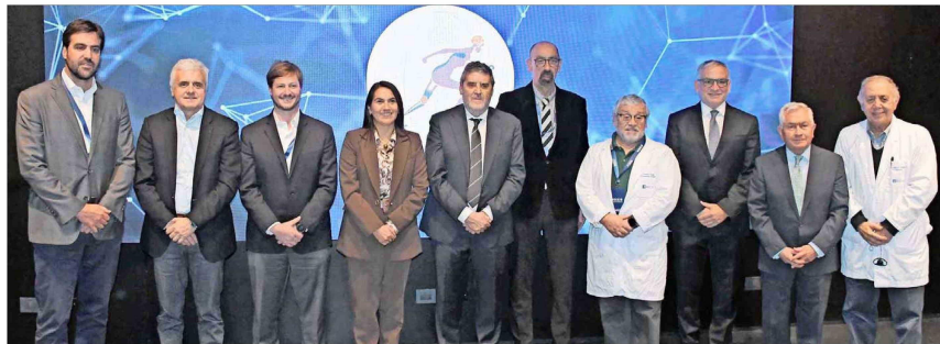
Autoridades académicas, institucionales, profesionales y prestadores de la salud fueron parte de la inauguración del Centro Noxis.

Tiraje: 126.654 Lectoria: 320.543 Favorabilidad: No Definida