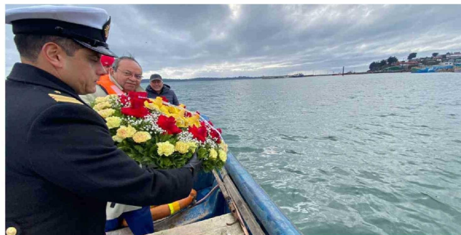
LANZARON OFRENDAS FLORALES POR LAS VÍCTIMAS DEL TERREMOTO Y MAREMOTO DE 1960.