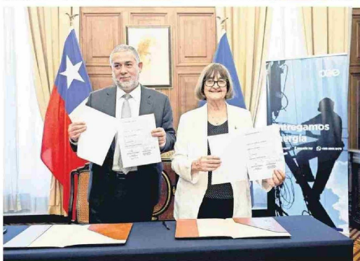
Con este acuerdo, las instituciones tendrán la oportunidad de compartir conocimientos.