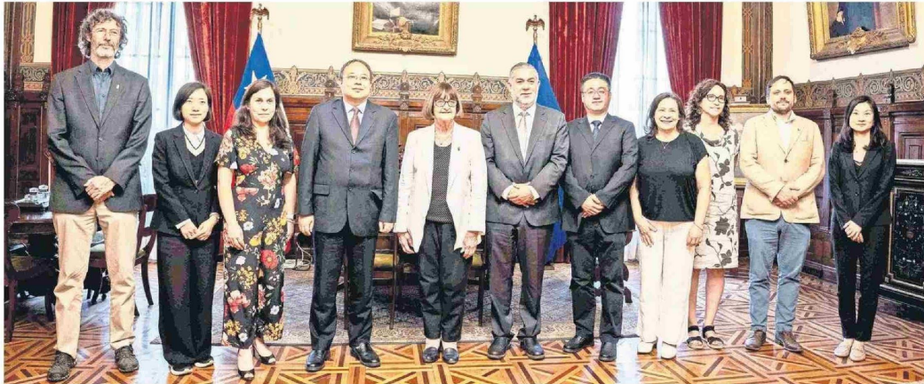
El convenio entre CGE y la Universidad de Chile permitirá desarrollar en conjunto iniciativas que permitan potenciar la cooperación técnica, investigación, asesorías y otras actividades.

Tiraje: 10.000 Lectoría: 30.000 Favorabilidad: No Definida