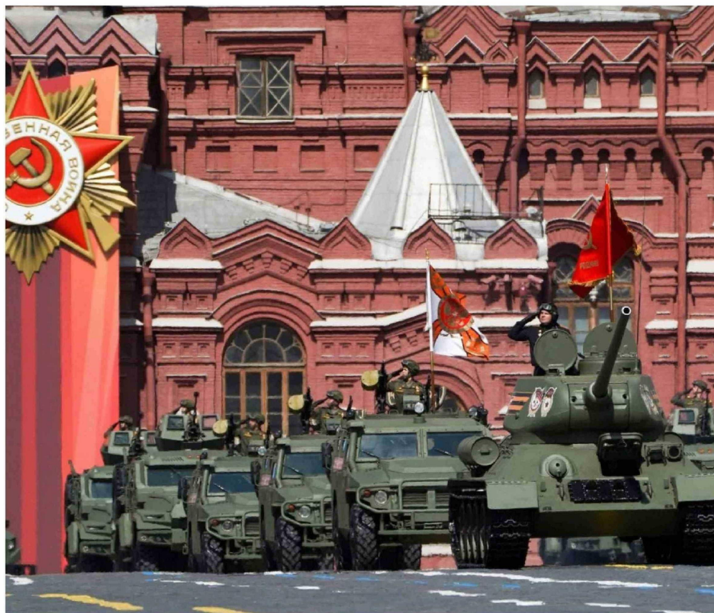
► Un tanque soviético E-34 encabeza columna de blindados en Plaza Roja durante el desfile militar en Moscú, el 9 de mayo de 2023.

Un sitio web de monitoreo que registra las quejas sobre el acceso a internet informó problemas con internet móvil en varias