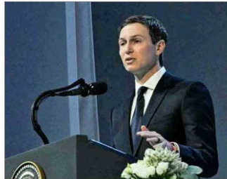
Jared Kushner, empresario y yerno de Donald Trump, presentó un cronograma para reconstruir Gaza, en el marco del "Consejo de Paz" que promueve el mandatario estadounidense.