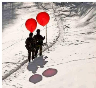
Soldados recorrian las inmediaciones del encuentro en Davos llevando globos rojos.

Chile con personas que tienen inversiones en nuestro país, y otros que prestan servicios profesionales a los empresarios criollos y sus empresas en la región. Hay varios motivos para estar orgullosos de nuestro país y para estar optimistas sobre el futuro. En primer lugar, Chile es todavía percibido como la nación con la estructura institucional más estable y fiable para hacer inversiones en todo el continente latinoamericano. Y en segundo lugar, se le reconoce a nuestro país el tener una sociedad con un nivel de educación y capacidades que está muy por encima de las otros países. De hecho, esta gente ya no asocia a Chile con las realidades político-económicas que son típicas (en el sentido negativo) de la noción de América Latina.