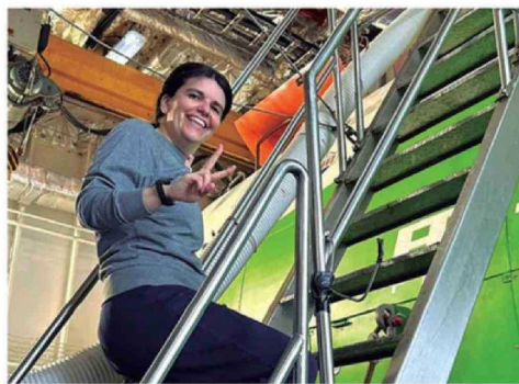
PEÑA ES LA SEGUNDA MUJER CHILENA EN DESCENDER A LA FOSA.

La profesional agregó que “la experiencia resulta difícil de describir: se experimenta una profunda sensación de tranquilidad al dimensionar lo pequeño que uno es frente a la inmensidad del océano. Desde el punto de vista científico, explorar a esta escala transforma la mirada profesional; regreso con la convicción de haber observado fenómenos únicos y con la responsabilidad de analizar estos datos para generar conocimiento inédito sobre el subsuelo marino chileno”.