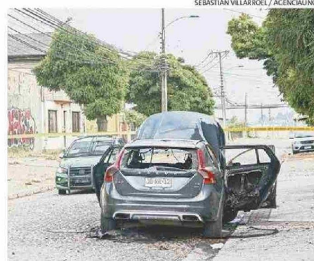
TRES JÓVENES FALLECIERON TRAS UNA BALACERA REGISTRADA A FINES DEL AÑO 2022 EN EL BARRIO BOHEMIO DE CONCEPCIÓN.

de abril de 2025, dos jóvenes de 21 años resultaron heridos a bala al interior de otro local nocturno en Concepción. Finalmente, el 2 de agosto de 2025, una nueva balacera se registró en las inmediaciones de una discoteca clandestina ubicada en el sector Barrio Estación, de